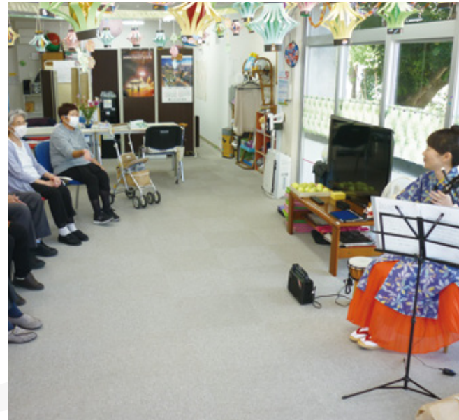
沖縄民謡生演奏会